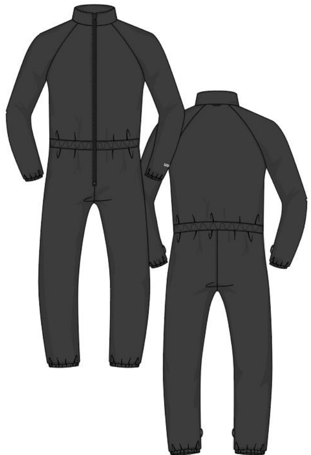
Modell: 7779 Art.-Nr.: 17805