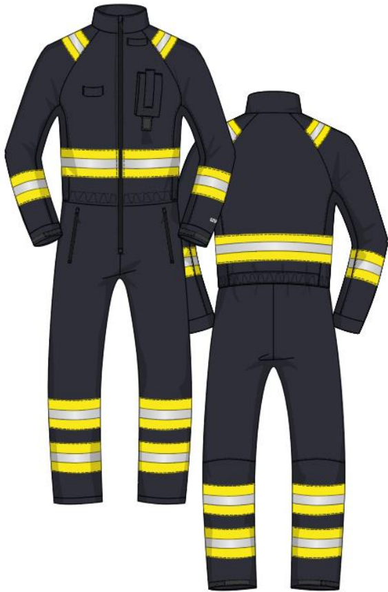
Modell: 7778 Art.-Nr.: 17804