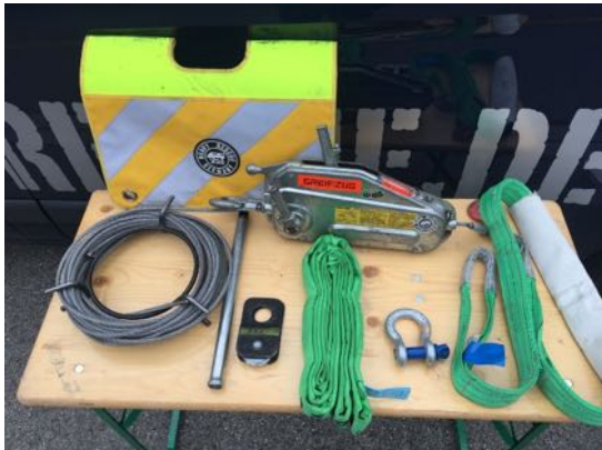
(im Bild die alte Version der Umlenkrolle)